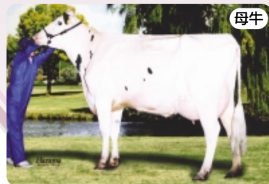
ハイイースト テンプトレスト マム ET