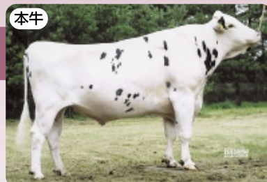
レディスマナー テンプトレスト ハイデン ET