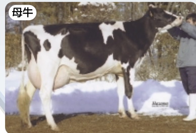
ライブリー フルーティ ハーシエル ET