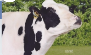
ライブリー ハヤ マダー