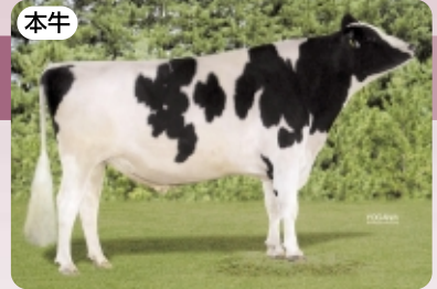
ストークランド DD シュー マツハー